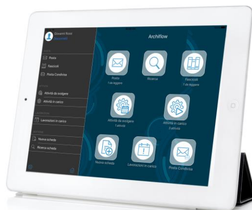
Organizza il tuo lavoro con l'interfaccia semplice e piacevole di Archiflow Mobile

Non hai più bisogno di duplicare o trasferire via email documenti e informazioni aziendali, ma puoi operare direttamente sugli originali, dentro il tuo sistema di gestione documentale, con un elevato standard di sicurezza, aumentando velocità ed efficienza e rispettando le policy di sicurezza e condivisione della tua organizzazione.